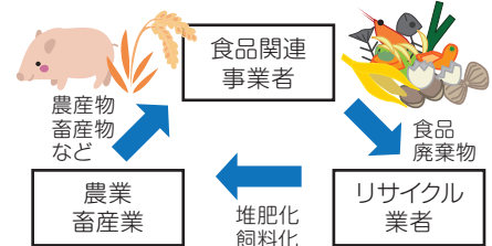
〈食品リサイクルの流れ〉